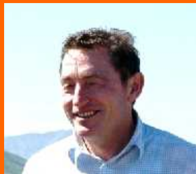
“vom Stiegler Hof”

Participarán 2 jueces de la Siegerschau alemana 2012.