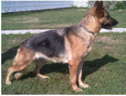
Creola dell'Isola dei Baroni