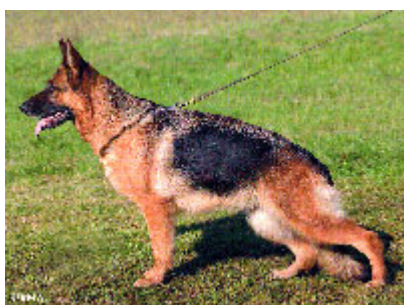
Saskia - hija de Lex dell 'Isola dei Baroni