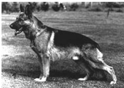
Canto v. d. Wienerau