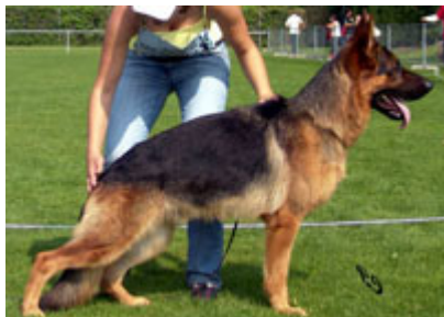
Zeuz dell 'Isola dei Baroni