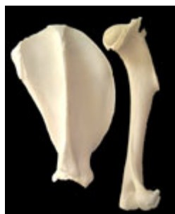
Escápula y Húmero

Que la longitud del húmero sea igual a la longitud de la escápula puede ser más que nada una tradición científica proveniente quizás del Bóxer, el Rottweiler y el Schnauzer Gigante, mientras en el Pastor Alemán, midiendo atentamente 6 sujetos en 5 el húmero era de promedio 2 centímetros más largo que la escápula.