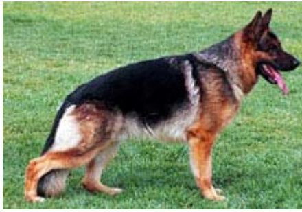
LEX dell'Isola dei Baroni

Afirmo que una línea superior del cuello suavemente arqueada, que inicia en la zona occipital y delicadamente se diluye evita el llamado "cuello de ganso" ( defecto )