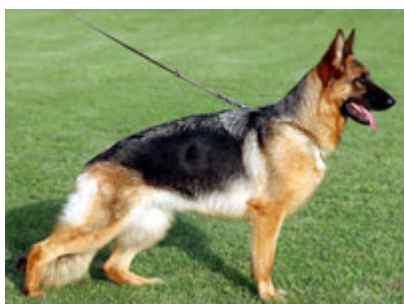
Mandy dell 'Isola dei Baroni