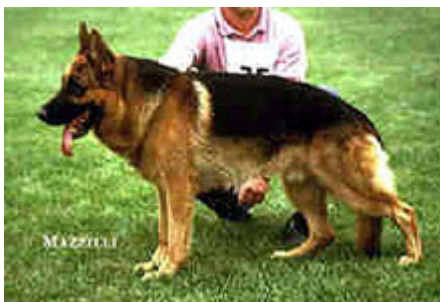
YAGO v. Wildsteiger Land