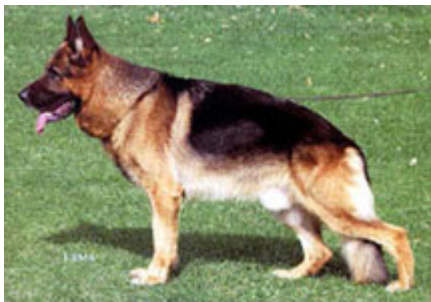
Ursus v. Batu

Un cuello "seco", sin "giogaia" y fuerte, completa la imagen ideal para una raza de trabajo con el Pastor Alemán, dinámico y al mismo tiempo bello y distinguido. En la actualidad, encuentro exagerado las proporciones de cabezas y sus consecuentes desarrollos musculares y óseos del cuello en algunos sujetos provenientes de URSUS v. Batu.