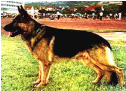
QUANTO v. d. Wienerau

Se han visto muchos sujetos provenientes de MUTZ v. Pelztierfarm con cuello relativamente corto y el paso y la distinción eran características por ello.