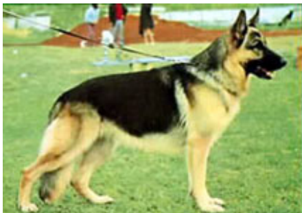
MUTZ v. Pelztierfarm