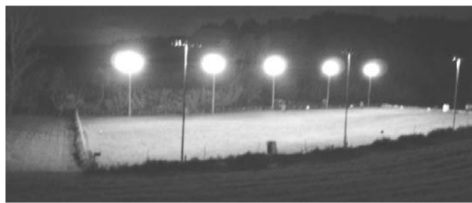
Vista nocturna de las instalaciones 40.000 W